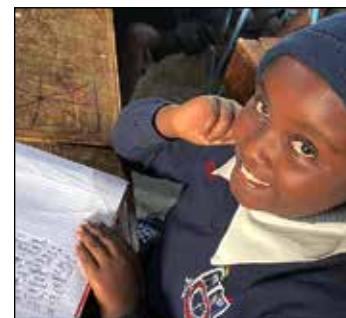
Briefe schreiben, um Kinder aus einem anderen Land kennenzulernen.